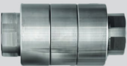
Açler Inox - Pmax 25 bar - T°max 155°C - T°min -20°C

Pa trajtim, guri gëlqeror pr aranzhëm në ujë bëhet ngjeshur. Me trajtim, efekti i vobullës i kombinuar me aragonitin do të ketë një efekt pastërimi nga gërryerja, guri gëlqeror tashmë i pranishëm do të zhduket burtësisht.