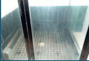
Ekrani i bardhë i dushit