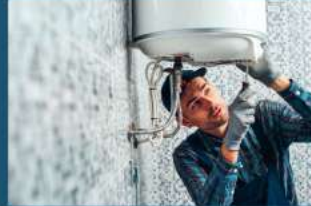
Dëmtimi i ngrohësit tuaj të ujit

Por nuk është faji juaj ! Ne jetojmë në një zone me ujë të pasur me minerale (kalcium, magnez), i cili pershpejton formimin e gurëve gëlqerorë të ngjeshur ne shtëpinë tuaj. Qëllimi ynë është të zvogëlojmë rrezikun e zgjidhjes së problemeve dhe ta bëjmë atë pothuajse ZERO. Sistemi ynë do të neutralizojë gurin gëlqeror duke e shëndërruar atë në një pluhur të imët inert (aragonit), i cili do të jetë pak ose i pa dukshëm. Aragoniti është një formë guri gëlqeror që nuk ngjeshet më (nuk bëhet i fort) dhe që do t'ju lejojë të ruani pajisjet dhe aparatet tuaja.