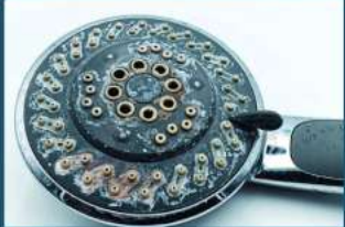
Pajisje Sanitare e shkallëzuar

Në të vërtetë, është i shtrenjtë për shkak të riparimit dhe mirëmbajtjes së zgjidhjes së trajtimit tradicional të tipit të zbutësit të ujit të kripur. Kushton shtrenjtë sepse guri gëlqeror i prish pajisjet tona sanitare shtëpiake dhe kërkon vazhdimisht kimikate për neutralizimin e tij, është i shtrenjtë sepse shkakton edhe një mori rrjedhjesh dhe riparimesh për shkak të ngopjes së tij.